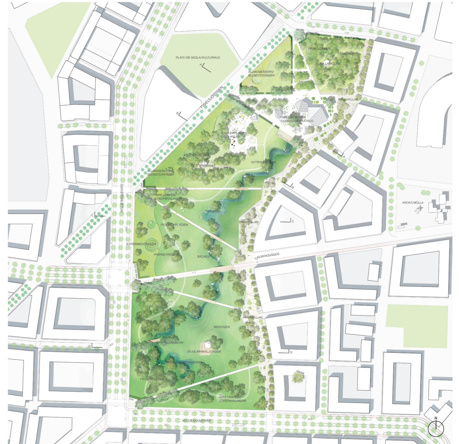
Situationsplan över parken med omgivande kvarter. Här syns Parkens hjärta med växthuset längst i norr. Strax söder om detta ligger temalekplatsen och klätterskogen. Längst söderut ligger framtidsskogen och skyfallssänkan. Dagvattenstråket går att följa genom hela parken Site plan of the park with the surrounding quarter, showing the heart of the park with the greenhouse to the north. Immediately south of this lies the theme area and climbing woods. To the far south lies the future forest and the cloudburst reservoir. The rainwater stream runs through the entire park

Tävlingen genomfördes i två steg. I början av 2018 lämnades 24 prekvalificeringar in, varav fyra team valdes ut att tävla om förstapriset. Den 28 augusti 2018 annonserades det vinnande förslaget ”Framtidens park är aldrig färdig” framtaget av Nyréns Arkitektkon-