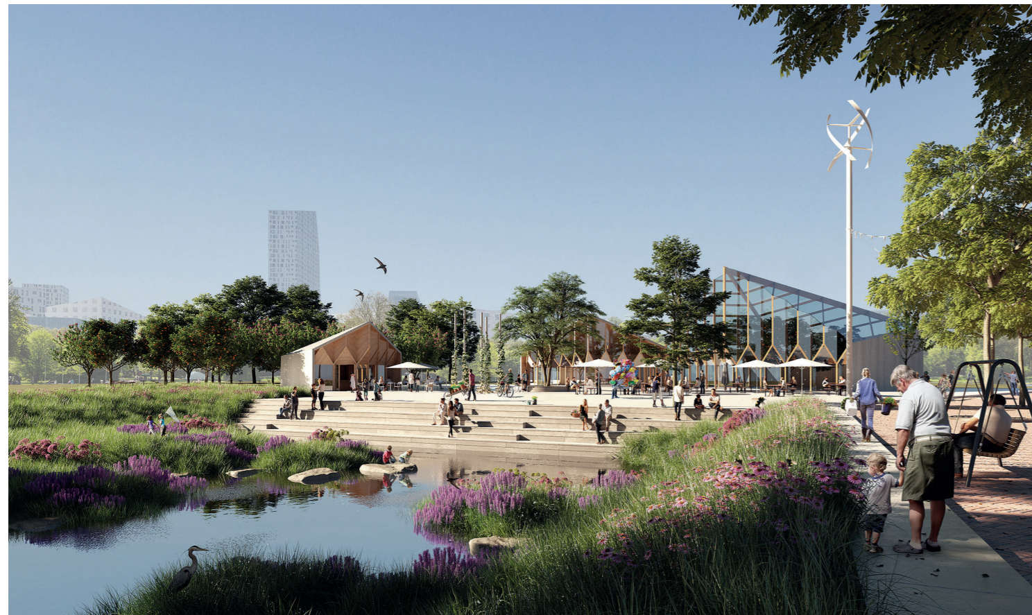
Platsen kring Parkens hjärta sedd från söder, med soltrappan och dagvattenstråket i förgrunden. Det generösa växthuset med anslutande cafébyggnad blir en viktig mötesplats under alla årstider. Efter behov kan fler byggnadskroppar tillkomma och nya funktioner läggs till. På så sätt skapas ett myller av små och stora platser under ständig utveckling. Bild framtagen av Nyréns visualiseringsstudio The area around the heart of the park seen from the south, with the sun steps and the rainwater stream in the foreground. The large greenhouse with connecting café building will be an important meeting place at all times of the year. When needed, several building elements can be added with new functions, creating a throng of large and small spaces under constant development. The picture was produced by Nyréns visualization studio

”För att möta Malmös och Hyllies utmaningar utnyttjar parken kraften i ständig förändring. Målet är att sammanfoga, väcka kreativitet och ge rum för myller, mänsklighet och naturfascination. Den dynamiska förändringen öppnar upp för delaktighet och är Hyllies chans att länkas samman med hela Malmö.” Så lyder utdrag ur det vinnande förslaget för Hyllies kommande stadsdelspark.